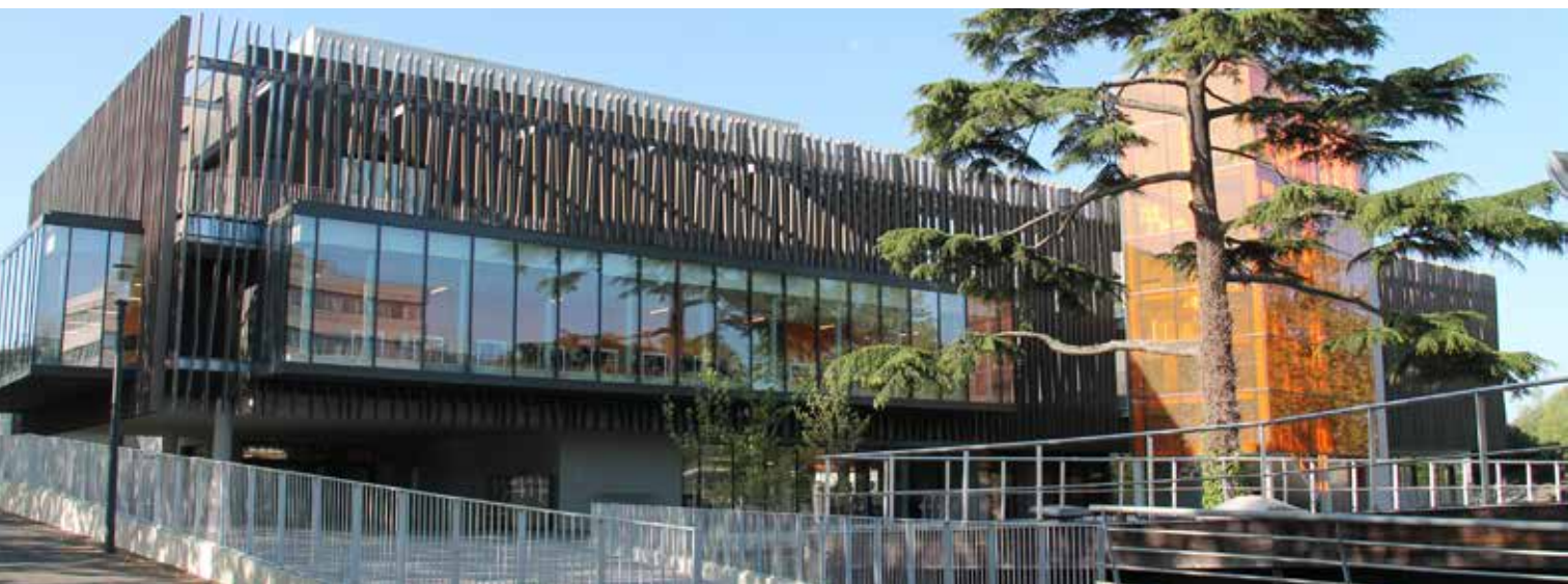
© Crous de Bordeaux Aquitaine / L'Atelier François Guibert Architectes

Le Mascaret possède une salle de restauration, un bar, un espace libre-service et de vente à emporter ainsi qu'une salle VIP, le tout décoré avec soin par le cabinet Osmoze, « atelier d'art mural contemporain ». La proposition graphique retenue est inspirée par la science et la médecine, reprenant des formes symboliques tel que l'Adn.