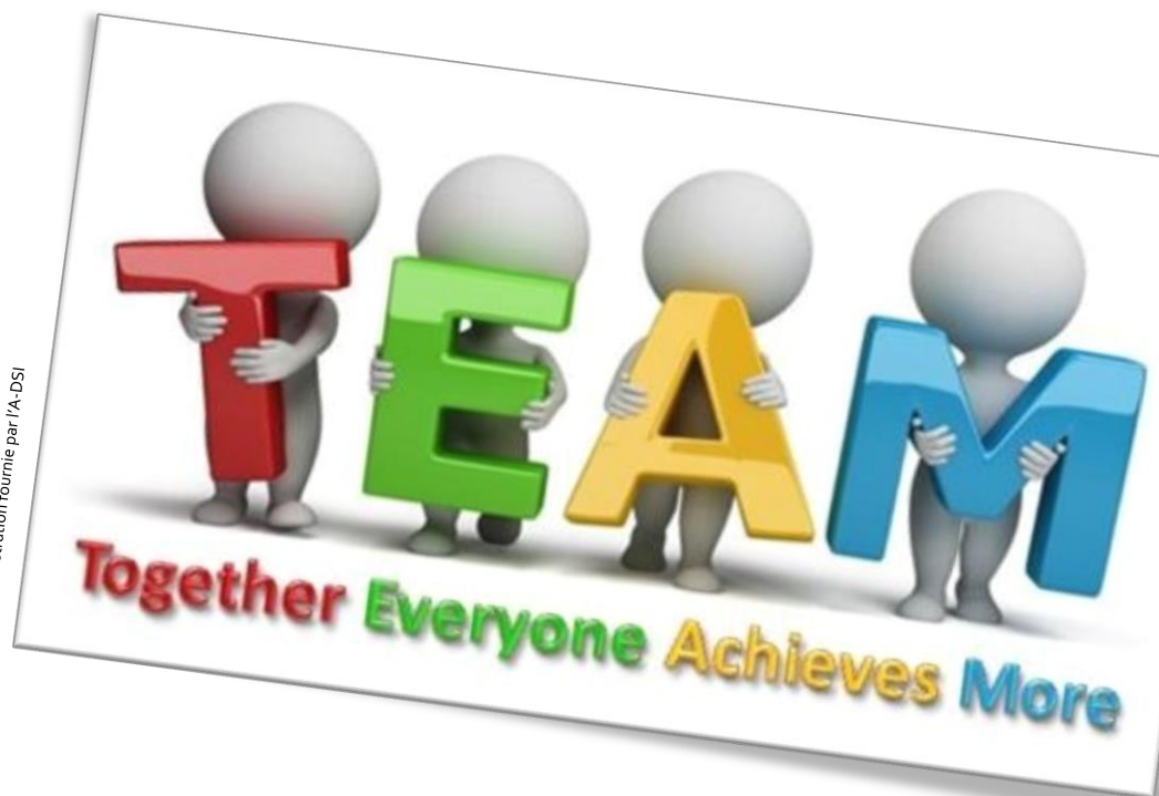
Illustration fournie par l'A-DSI